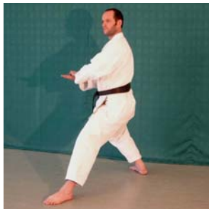
Kokutsu- Dachi Hidari Ken Chudan- Zuki