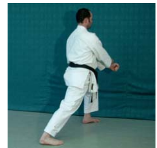
Kokutsu- Dachi // Hidari Shuto Gedan Uke / Shuto Hidari Koshi Mae Kamae