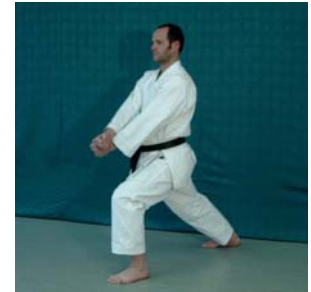
Zenkutsu- Dachi // Ryo Ken Juji Gedan Kosa- Uke