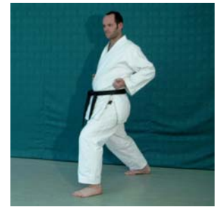
Zenkutsu- Dachi // Ryo sho Nigiri Mune Mae Juji Kamae