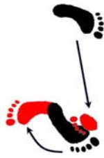
Kosa Dachi Ryo Ken Chudan Kakiwake