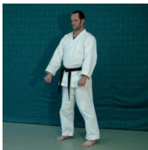
Musubi – Dachi