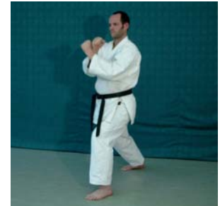
Zenkutsu- Dachi // Ryo Ken Juji Gedan Kosa- Uke