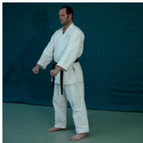
Kokutsu- Dachi Ryo Sho Jodan Sokumen Awase-Uke