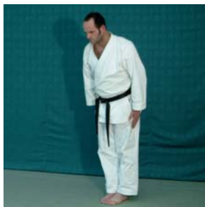
Musubi – Dachi